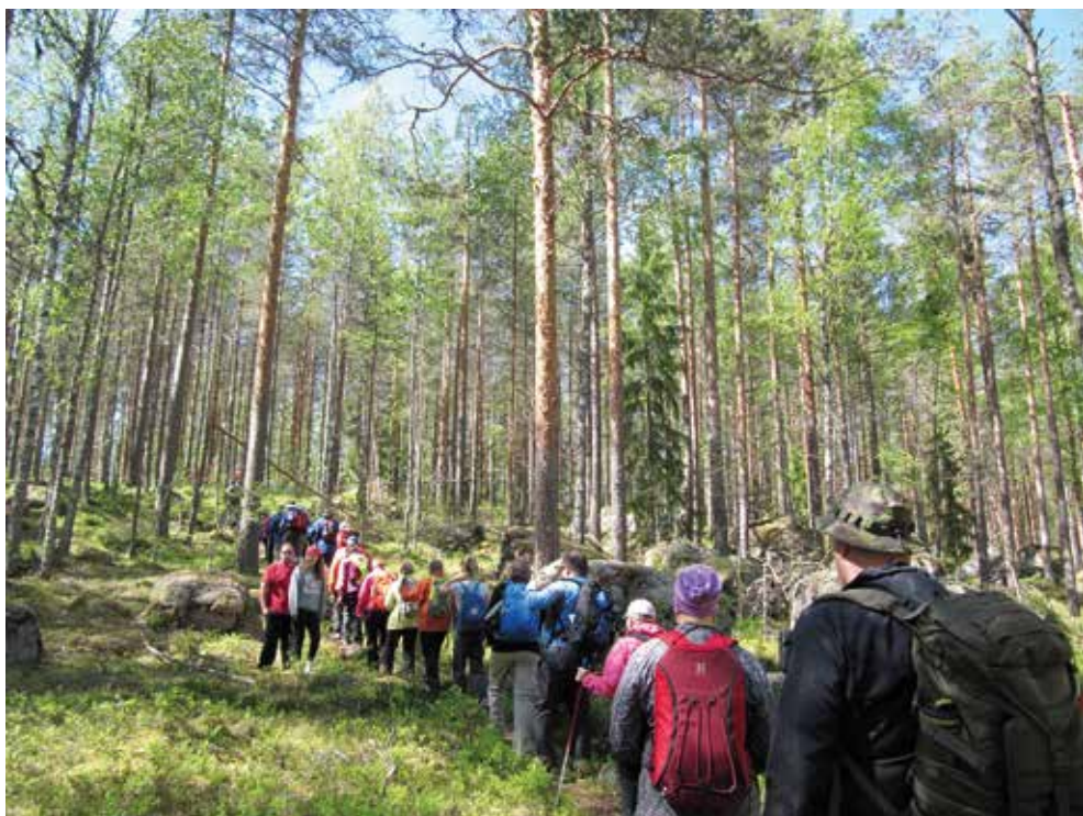
Paistjärven retki keräsi väkeä.